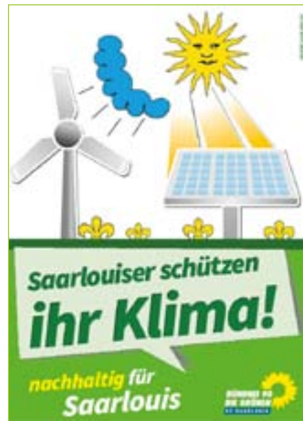
Die Saarlouiser Grünen werben für den Klimaschutz – der fördert die Effizienz und spart langfristig Steuergeld.